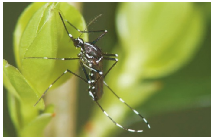
Asiatische Tigermücke (Foto: B. Pluskota, KABS e.V.).

In Ihrer Gemeinde wurde durch aufmerksame Bürger die Asiatische Tigermücke ( Aedes albopictus ) entdeckt.