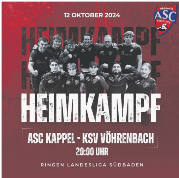
Heimkampf gegen Vöhrenbach

Am nächsten Samstag ist der nächste Heimkampf gegen Vöhrenbach um 20:00 Uhr.