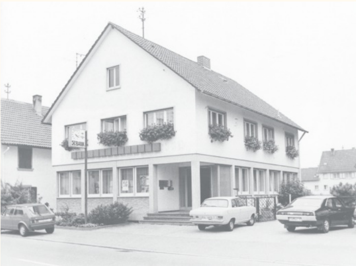
Das neue Bankgebäude Anfang der 70er Jahre in der damaligen Kirchstraße (heute Rathausstraße).