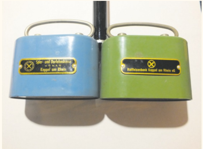
Zwei Spardosen aus vergangener Zeit erinnern an den Weltspartag.