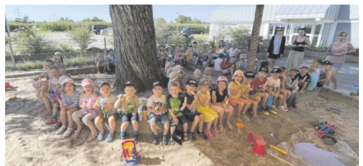
Toller Start in die Sommerferien