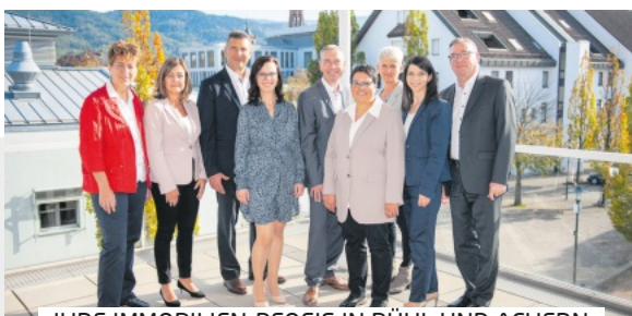
IHRE IMMOBILIEN-PFOFIS IN BÜHL UND ACHERN