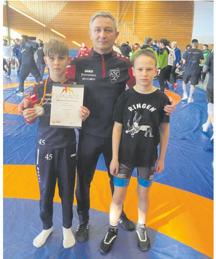
Südbadische Meisterschaften - C-Jugend