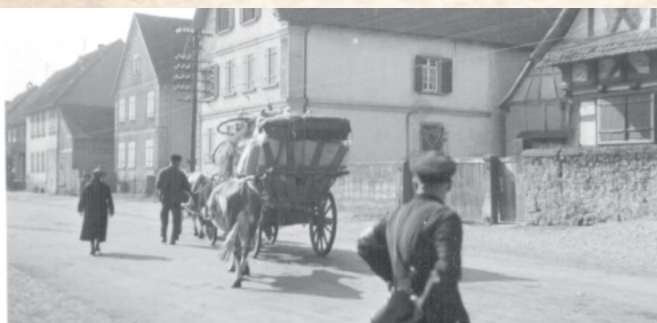
Rückkehr nach Kappel 1939 und 1940