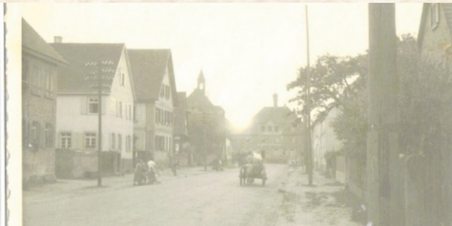
Kirchstraße (heute Rathausstraße) vor dem Zweiten Weltkrieg