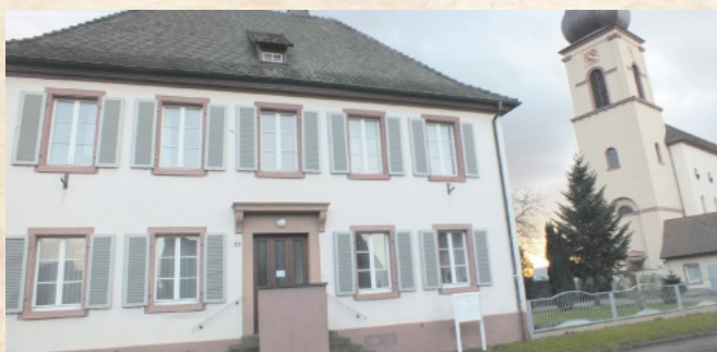
Am 6. Januar 1955 wurde das neue Pfarrhaus eingeweiht.