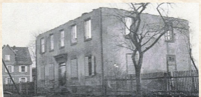
Das zerstörte Pfarrhaus