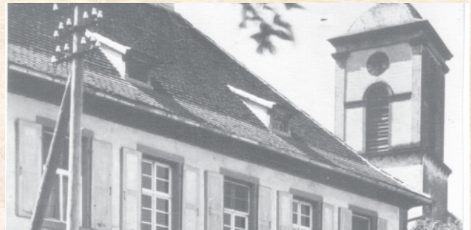
Das Pfarrhaus und die Kirche vor der Zerstörung