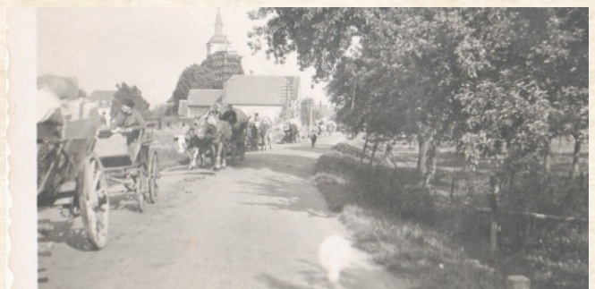
Frauen, kleine Kinder und ältere und kranke Leute verlassen Kappel, im Hintergrund die alte Pfarrkirche